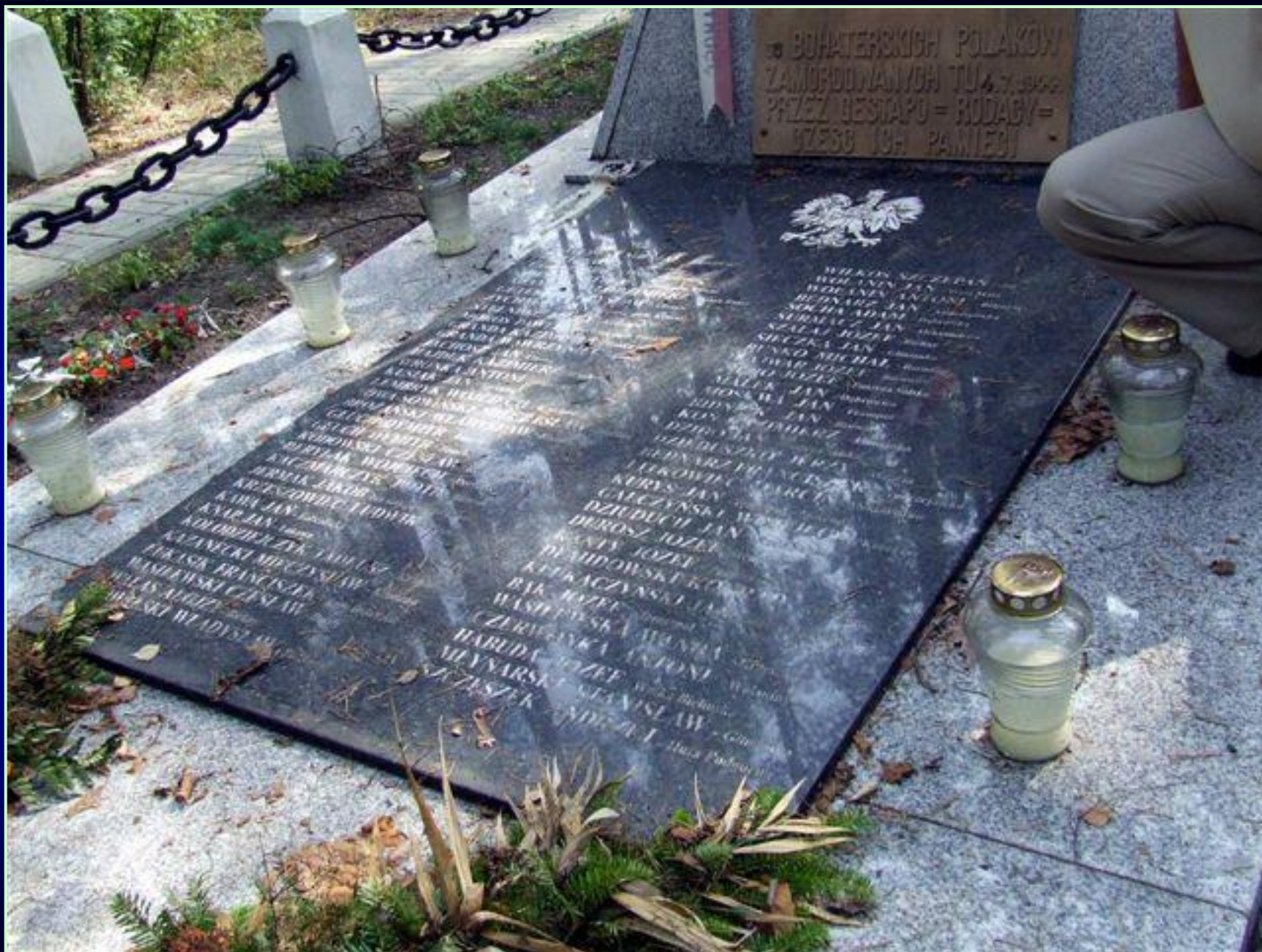
Victims names engraved in the memorial plate