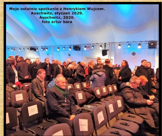
נוכח באירוע אזכרה באושוויץ