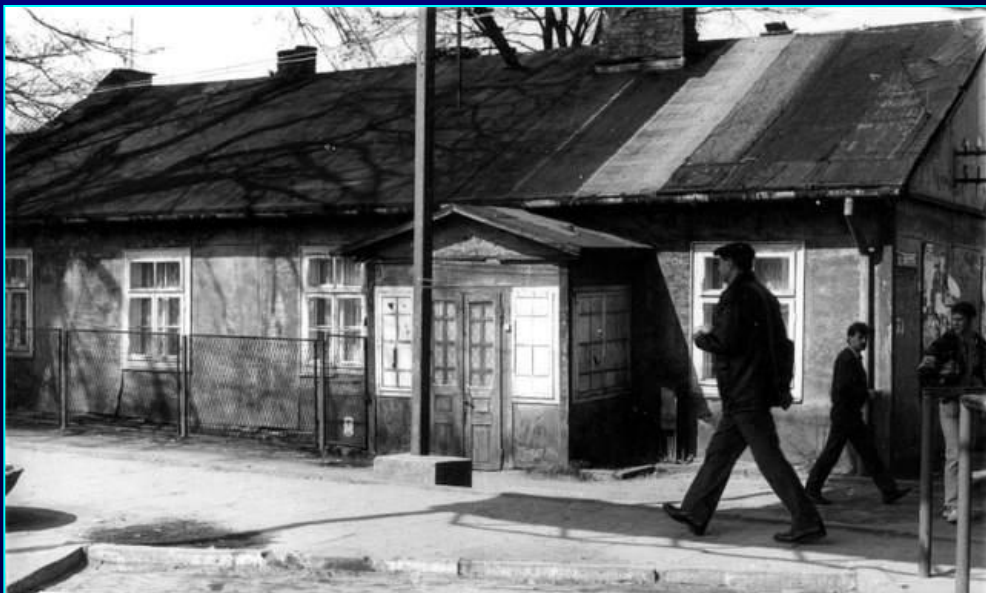
תחנת הרכבת הצרה [הקולייקה] "kolejka" station